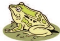
broasca de mlaștină